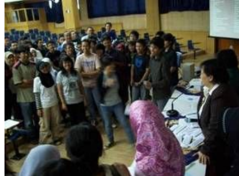
Workshop yang hidup dan interaktif pada sesi gaya berpikir

menunjukkan beberapa moment dan suasana saat workshop . (Kontributor: Koordinator TPB FITB, Budi Brahmantyo).